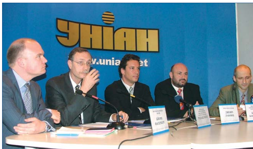
Партнеры Седеркопинского процесса на пресс-конференции в Киеве