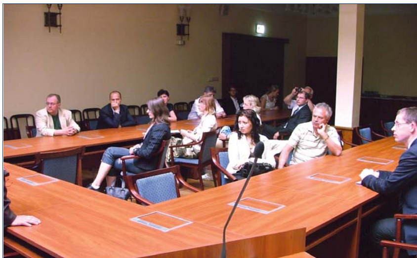
Участники ознакомительного визита в Консультативный центр по вопросам занятости в Будапеште

При содействии правительства Венгрии для участников из Беларуси, Молдовы и Украины был организован ознакомительный визит в Консультативный центр по вопросам занятости, в ходе которого они ознакомились с процедурами трудоустройства в Венгрии, трудовыми договорами и гармонизацией национальной политики со стандартами ЕС.