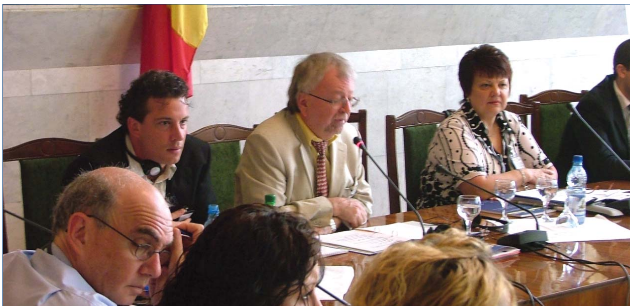
Участники семинара о роли неправительственных организаций в приграничном сотрудничестве