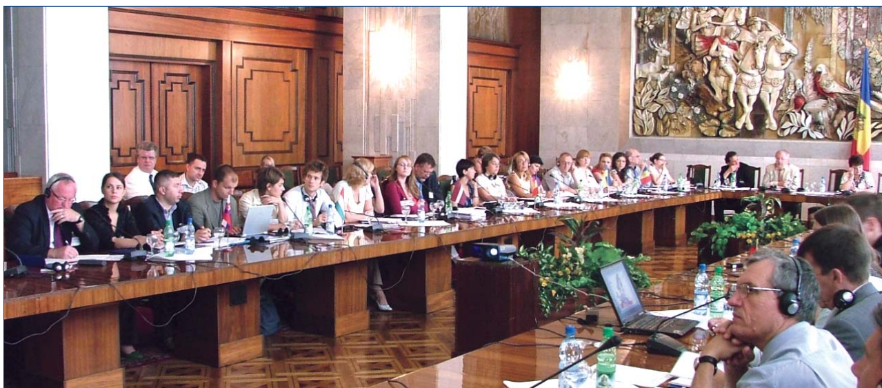
Участники семинара о роли неправительственных организаций в приграничном сотрудничестве