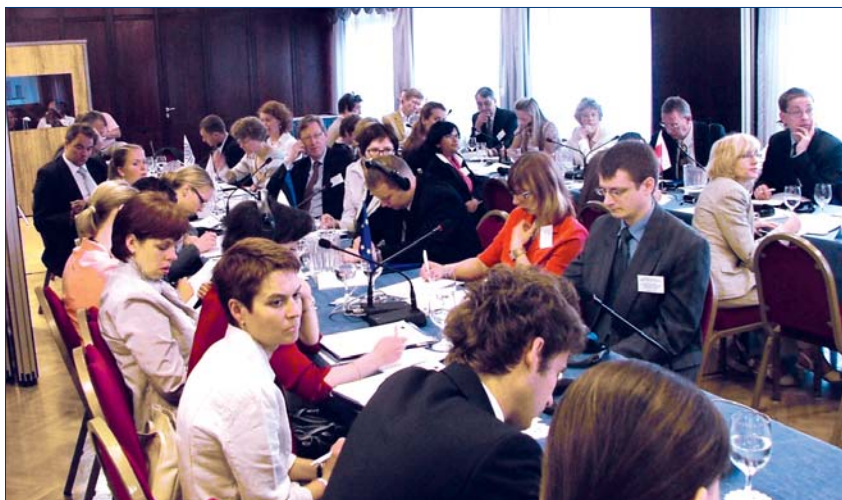
Участники семинара по трудовой миграции, интеграции и денежным переводам мигрантов

мигрантов в страны ЕС, наиболее актуальная проблема связана с возможностью сокращения оттока рабочей силы и целенаправленного использования потока денежных переводов для развития национальной экономики. Как подчеркнула делегация Молдовы, правительство в настоящее время проводит переговоры о заключении двусторонних соглашений о регулировании потоков трудовой миграции с Францией, Испанией, Португалией и Грецией, что, как предполагается, уменьшит отток граждан Молдовы в эти страны. Представитель ЕС представил последние политические документы, нацеленные на разработку комплексной европейской миграционной политики, которая направлена на поддержку легальной миграции, борьбу с нелегальной миграцией, налаживание сотрудничества с третьими странами и работу по целям развития.