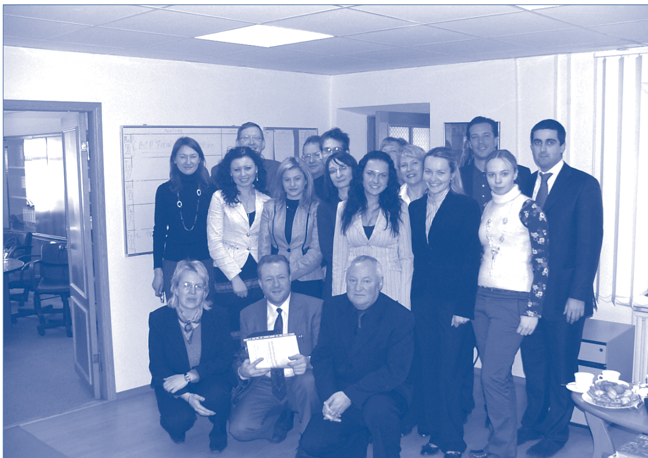
Участники Встречи национальных координаторов Седеркопингского процесса в Киеве

Была выражена сильная обеспокоенность правительства, в особенности Украиной, по поводу многократной подачи ходатайств о предоставлении убежища нелегальными мигрантами, которые таким образом "дискредитируют институт убежища и создают примеры позитивной дискриминации". Участники семина-