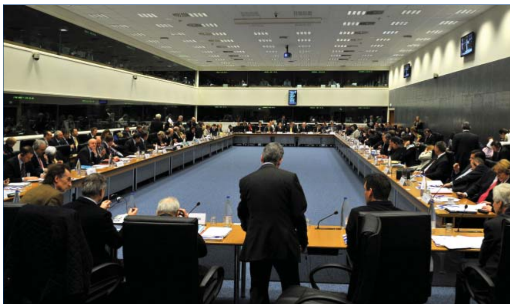
Участники Совета по вопросам юстиции и внутренних дел

Министры также поддержали практическое сотрудничество между государствами-членами ЕС и сотрудничество с третьими странами, поскольку они могут быть полезны в искоренении причин нелегальной миграции и нелегальных потоков лиц,