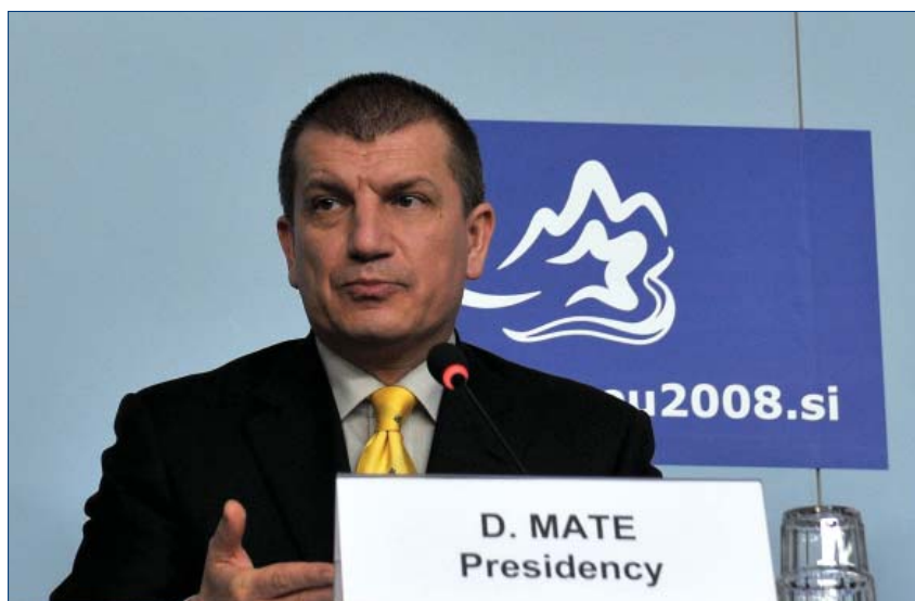
Г-н Драгутин Мате, Министр внутренних дел республики Словения

Критерии для публикации четкие и понятные. Авторы будут указываться по электронной почте, на сайте и в годовом отчете. Характеристики постоянных авторов будут приводиться в электронно-почтовом