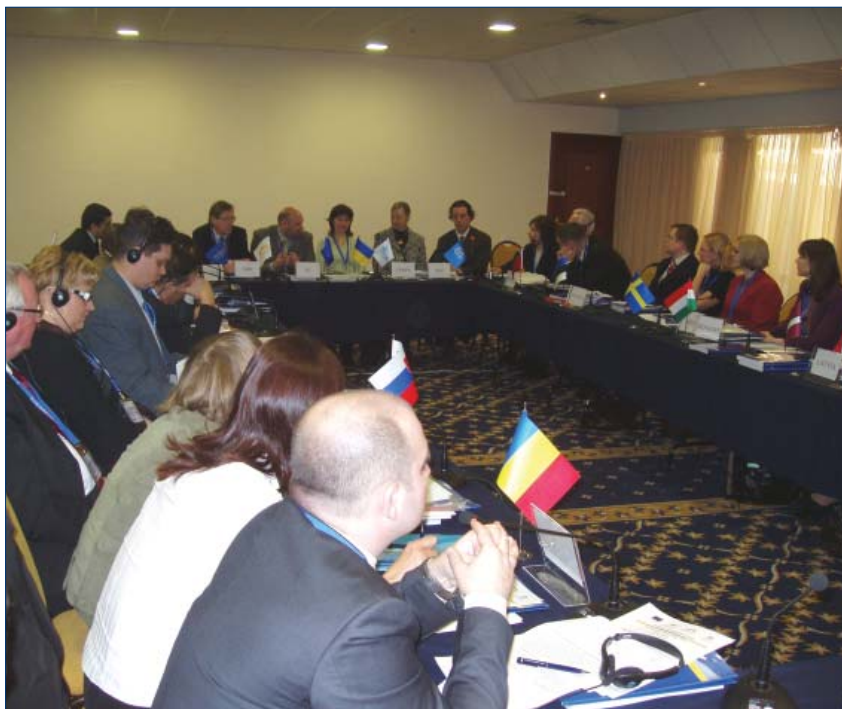
Участники семинара «Интеграция беженцев в контексте долговременных решений», 17-18 марта, Киев

Занятость и жилье – самые серьезные проблемы для большинства беженцев. Их зарплата обычно ниже, а арендная плата выше, чем у местных жителей. «Трудно снимать квартиру для многодетной семьи, потому что люди боятся, когда видят так много